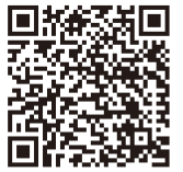
Premium Grade Bioactive Proteins