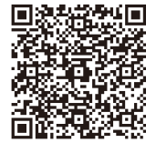
Proteins and Peptides